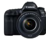
EOS 5D Mark IV