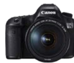
EOS 5DS R

EOS 5D Mark IV EOS 5DS EOS 5DS R EOS-1D X Mark II